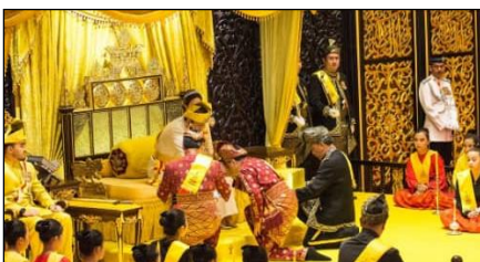
Gambar 6 : Menyembahkan Persembahan.