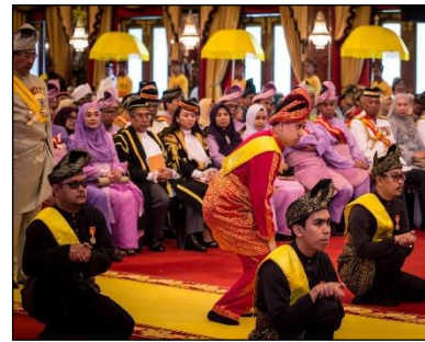
Gambar 3 : Seni Gerak Menjunjung Duli. Lembing Koleksi Sembuana. Koleksi peribadi.