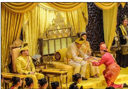
Gambar 4 : Menerima keris kuasa. Koleksi peribadi.