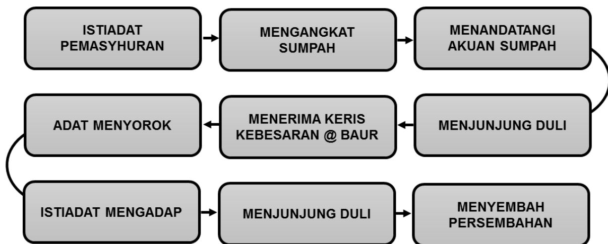
Rajah 1. Proses dalam adat menggelar di negeri Selangor.

Keunikan adat menggelar pembesar di alam Melayu adalah sama pada hakikatnya suatu masa lalu, iaitu dengan pemberian persalinan. Namun dewasa ini, berlaku beberapa evolusi tetapi masih melestarikan pemberian persalinan dan beberapa elemen lain menyerap masuk dalam adat menggelar pembesar di negeri Selangor, jika hendak dibandingkan dengan adat asal yang masih kekal di amalkan di negeri Perak, sehingga ianya menjadi satu adat istiadat yang unik untuk diuraikan. Berdasarkan kepada pemerhatian yang dilalui sendiri oleh pengkaji yang menghadiri Istiadat Pemasyhuran Gelaran dan Mengangkat Sumpah serta Menjunjung Duli bagi Orang-Orang Besar Istana, Orang Besar Daerah dan Dato'-Dato'Diraja Selangor yang berlangsung pada 17 Mac 2018 di Istana Alam Shah, Klang, terdapat beberapa proses dalam Istiadat Menjunjung Duli di negeri Selangor sebagaimana yang dinyatakan dalam Rajah 1.