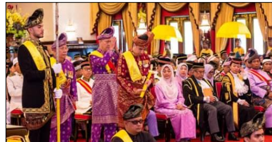
Gambar 5 : Mengadap setelah sempurna adat menyorok, persalinan kehormatan keris kebesaran.