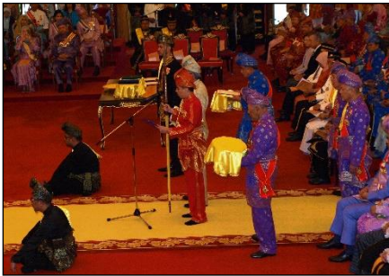
Gambar 2 : Mengangkat sumpah bersaksikan peribadi.