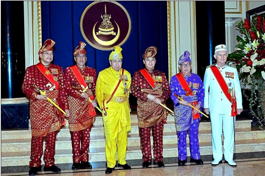
Gambar 7: Orang Besar Istana (Persalinan Merah Hati), Orang Besar Daerah (Persalinan berwarna Biji Kundang) dan Dato' Diraja (Pakaian Dres No. 1 bersongkok) memakai pakaian kehormatan rasmi selepas menyempurnakan Istiadat Menjunjung Duli sempena Pengisytiharan dan Pemasyhuran Gelaran.